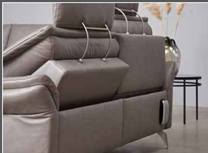
Variante 166 mit beidseitiger Wall-Free-Funktion