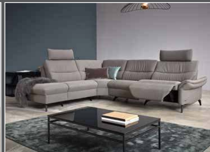
Zusammenstellung 585 / 156 in 24 Q2 Fashion grey