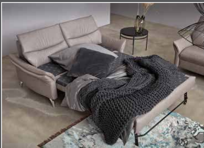
Variante 274 mit Bettfunktion und Armteilverstellung Liegefläche 135x190cm